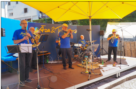
Ab 4. September wird auf dem Thüringer Dorfplatz gefeiert. Zum Auftakt spielt die „Imperial Jazzband“ zum „Ässa & Tschässa“ auf.

Schwungvolle Rhythmen und feine Speisen gehören in Thüringen nun schon seit fast zwanzig Jahren zum Sommerausklang: Am 4., 11. und 18. September treffen sich Musikfreunde und Feinschmecker wieder zum „Ässa & Tschässa“.