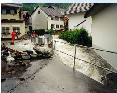
Fotoarchiv: Hochwasser 1999

Gerne möchten wir die Bevölkerung von Thüringen und Bludesch über das für die beiden Gemeinden, die Sicherheit betreffende, sehr wichtige Projekt informieren. Hierzu laden wir am 11.09. um 19:00 Uhr in die Musikmittelschule. Es werden die geplanten Bauarbeiten vorgestellt sowie etwaige Fragen beantwortet. Auf reges Interesse und Teilnahme freuen wir uns und bitten um Anmeldung bis spätestens 04.09. auf dem Gemeindeamt Thüringen unter der Nr. 05550 / 2211