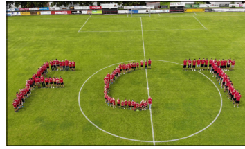
Das Foto entstand vor Corona im Jahr 2019